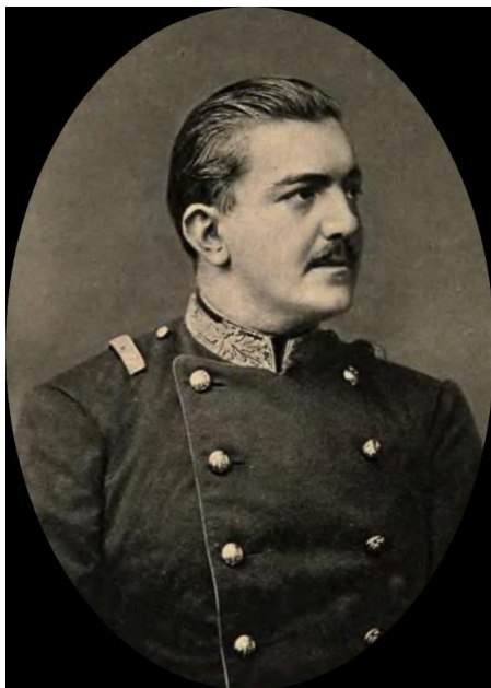
Краљ Милан Теодоровић – Обреновић.

У поменутом, 10. члану Устава још се, између осталог, наводи: „Но ако би садањи Књаз Милан без мушког потомства преминуо, онда прелази наследство престола србског на мушке потомке Књаза Милоша од кћери његових, тако, да народ србски од ових потомака бира себи за наследног Књаза онога, кога нађе да је најдостојнији. (...) А ако не би било мушких потомака од кћери Књаза Милоша, онда народ србски бира себи за наследног Књаза оног Србина, у коме има највише поверења...“ 171