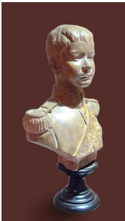
Биста краља Александра Теодоровића – Обреновића.

чак нису ни припадали племићком staleжу (ни вишем ни нижем племству).