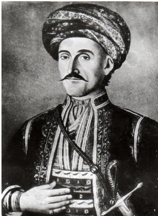
Господар Јеврем Теодоровић – Обреновић.

Господар Јеврем Теодоровић – Обреновић је са својом супругом добио сина Милоша и пет ћерки. Милош је био рођен 13. новембра 1829. у Шапцу, а преминуо је од туберкулозе, 8. новембра 1861. године у Београду. Сахрањен је у манастиру Раковица. 66