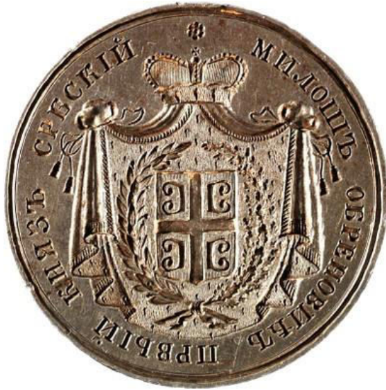
Печат књаза Милоша Теодоровића – Обреновића.

Милош је постао вођа Другог српског устанка 1815. године и потом „de facto“ владар Србије. Своју власт је утврдио различитим средствима, као што су: борба против Турака током устанка, гушење различитих побуна, бескрупулозна борба против опонената, дипломатија и поткупљивање турских званичника. 159